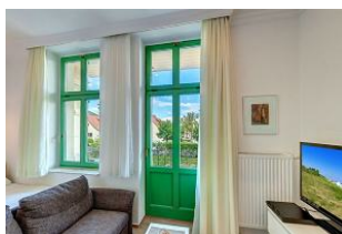
Küchenzeile und Eßplatz