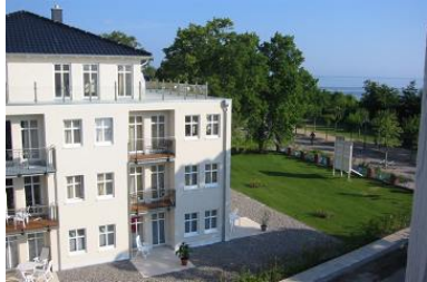
Hausansicht "Villa Aquamarina" von der Südseite (Nachbarhaus)