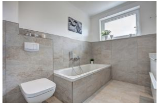
Bad mit Wanne