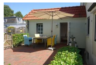
Die Terrasse noch einmal von der anderen Seite.