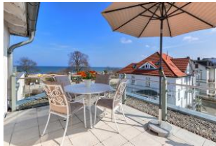
Dachterrasse mit tollem Meerblick