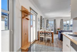
Küchenzeile mit Blick zum Essplatz