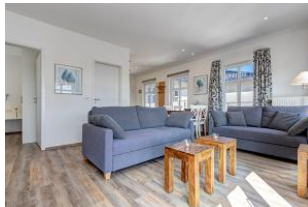
Wohnbereich mit Blick zum Essplatz