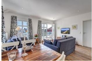
Essplatz mit Blick in den Wohnbereich