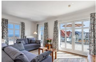
Wohnbereich mit Meerblick

1. Reihe, PENTHOUSE direkt an der Strandpromenade mit SEEBLICK, DACHTERRASSE und FAHRSTUHL im Haus! Chices geräumiges 3-Zimmer-Apartment mit moderner hochwertiger Ausstattung. Zwei separate Schlafzimmer, Wohnzimmer mit Küchenbereich und Essplatz, Duschbad, 45 qm Dachterrasse über Eck nach Osten und Süden mit Sonne von morgens bis abends und herrlichem Seeblick. Die Wohnung verfügt über einen Tiefgaragen-Pkw-Stellplatz. In der Garage können auch Fahrräder und ähnliches untergestellt werden. In unserer "Villa Germania" nebenan gibt es eine Sauna. Von der "Villa Aquamarina" sind es zum Ortszentrum und der Seebrücke ca. 3 Minuten zu Fuß. Zum Strand sind es 50 m.