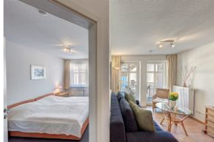
Tür zum Schlafzimmer