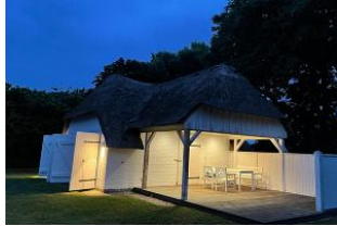
Saunahaus im Garten