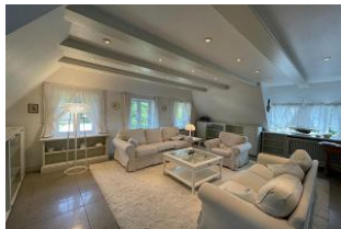
grosses helles Wohnzimmer