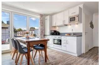
Küche und Essplatz