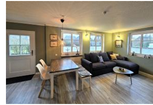
Der gemütliche Wohnschlafraum ist lichtdurchflutet und bietet zusätzlich eine nette Ess- und Sitzgruppe an.