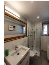
Das hellgeflieste Duschbad mit Fenster.