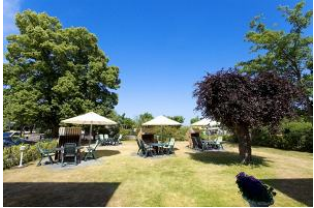
Garten mit Terrassen und Strandkörben (Mai bis September)