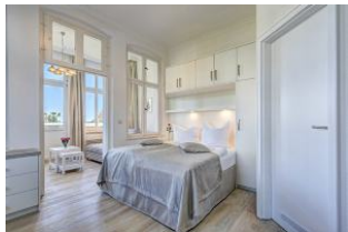
Schlafbereich und Blick in die Veranda

Direkt an der Strandpromenade mit großem GARTEN! Gemütliches 2 - Zimmer - Apartment mit guter Ausstattung. Kombiraum mit Doppelbett, Küchenzeile mit Essplatz, Duschbad und Veranda als Wohnraum mit direktem Gartenzugang und Terrasse. Die Wohnung verfügt über einen Pkw-Stellplatz. In der Garage können Fahrräder und ähnliches untergestellt werden. Im Haus gibt es eine Sauna. Von der "Villa Germania" aus können Sie das Ortszentrum und die bekannte Ahlbecker Seebücke in ca. 3 Minuten zu Fuß erreichen. Zum Strand sind es 50 m. Von Mai bis September ist ein Strandkorb im Tagespreis enthalten.