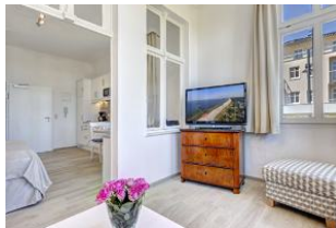
Veranda mit Blick zur Küchenzeile