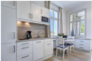
Küchenzeile und Essbereich