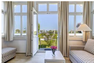
Veranda mit direktem Gartenzugang und dortiger Terrasse