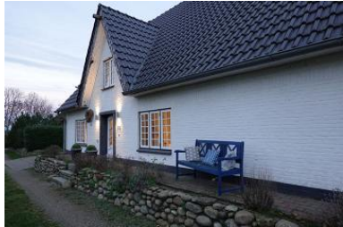
Die Aussenansicht des Hauses Friesengeist in Wrixum, Ohl Dörp 25

Die Unterkunft verteilt sich über EG und 1.OG.