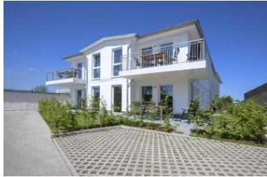
Hausansicht Neubau Villa Margarete