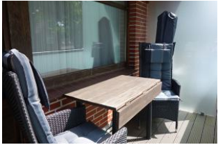
...ein Platz an der Sonne auf dem Balkon