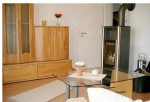
Wohn-/Schlafzimmer mit Kaminofen und Schlafcouch (140 cm) für 5. und (wenn gewünscht) 6. Person