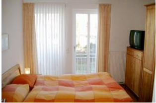
Schlafzimmer mit Balkonzugang