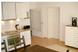
Gut ausgestattete Küche mit großem Essplatz

Strandnah mit SÜDTERRASSE, Balkon und KAMINOFEN! Großzügige und gut ausgestattete 3-Zimmer-Wohnung mit zwei separaten Schlafzimmern, großer Küche mit Eßplatz, Wohn-/Schlafzimmer mit Kaminofen und 140 cm Schlafcouch für die 5. Person, Bad mit Wanne und Dusche, zusätzliches Duschbad, Eingangsflur. Die Wohnung hat einen separaten Eingang. Vom Haus aus können Sie das Ortszentrum und die bekannte Ahlbecker Seebrücke in ca. 3 Minuten zu Fuß erreichen. Zum Strand sind es ca. 80 m Luftlinie. Für Brennholz muß - wenn Kaminofennutzung gewünscht ist - selbst gesorgt werden (im nahegelegenen Supermarkt oder bei uns erhältlich). Diese Wohnung verfügt nicht über WLAN.