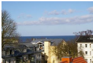
Seeblick aus der Veranda Ostseewarte Nr. 14