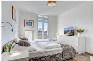
Schlafzimmer mit Zugang zum Balkon