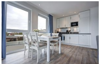
Essplatz und Küche