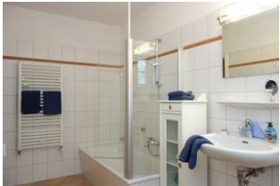
Das Bad mit Badewanne (+Duschkmöglichkeit)