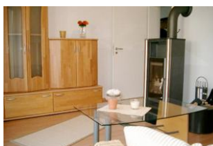
Wohn-/Schlafzimmer mit Kaminofen und Schlafcouch (140 cm) für 5. und (wenn gewünscht) 6. Person