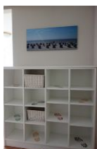
Der Eingangsbereich mit viel Platz für Schuhe