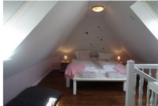
Das Schlafzimmer im Dachgeschoß mit Doppelbett 180x200 und sep. Duschbad.