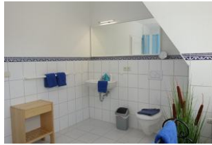
Das große Badezimmer im OG mit....