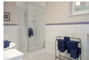
Das Duschbad im UG, daneben noch ein Abstellraum und die Waschmaschine.