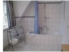
Badewanne, Duschmöglichkeit vorhanden.