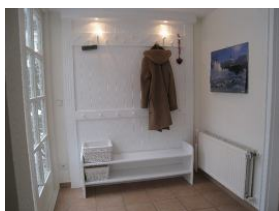
Der Eingangsbereich mit großer Garderobe

Idyllischer kann man mitten in der Stadt kaum wohnen. Das Haus Johanna liegt in der Feldstrasse in zweiter Reihe. Zum Strand sind es nur 3 Gehminuten, zum Bäcker ebenfalls. Herrlich, auf der Terrasse sitzen und es sich gut gehen lassen - hören werden Sie außer dem eigenen Familiengeplapper nur das Geklapper der auf Föhr lebenden Störche von nebenan. Idylle in der Stadt .....! Vier Schlafräume, drei Bäder und gemeinschaftliche Räume lassen auch der Großfamilien oder befreundeten Familien genügend Raum zur Erholung. Neuigkeiten: nebenan, im gleichen Haus gibt es jetzt noch eine Wohnung für 4-5 Personen - unsere Johanna 2