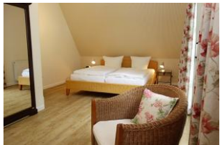
Das große Elternschlafzimmer im OG, nicht im Bild: TV Gerät