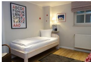
Ein Schlafzimmer mit 2 Einzelbetten, je 90x200cm