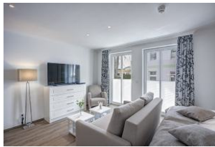
Flachbild TV und Couch