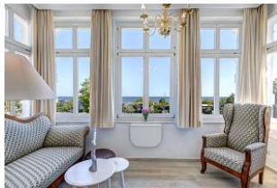
Blick in die Veranda