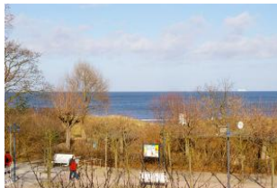
Seeblick aus der Veranda