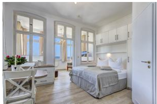
Blick in die Wohnung mit Seeblick

Direkt an der Strandpromenade mit herrlichem SEEBLICK aus der Veranda! Schönes 2 - Zimmer - Apartment mit gemütlicher und guter Ausstattung. Kombiraum mit Doppelbett, Küchenzeile mit Essplatz, Duschbad und Veranda als Wohnraum mit direktem Seeblick. Die Wohnung verfügt über einen Pkw-Stellplatz. In der Garage können Fahrräder und ähnliches untergestellt werden. Im Haus gibt es eine Sauna. Von der "Villa Germania" aus können Sie das Ortszentrum und die bekannte Ahlbecker Seebrücke in ca. 3 Minuten zu Fuß erreichen. Zum Strand sind es 50 m. Von Mai bis September ist ein Strandkorb im Tagespreis enthalten.