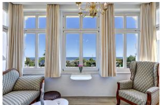
Veranda mit Seeblick