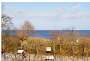
Seeblick aus der Veranda