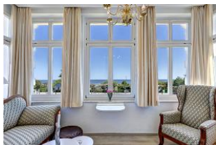
Veranda mit Seeblick