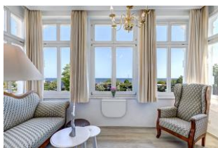
Blick in die Veranda