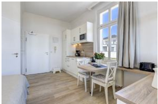
Blick auf Essplatz und Küchenzeile