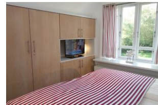
...und TV Gerät, großem Kleiderschrank