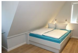
Das zweite Schlafzimmer mit Doppelbett, Bettmaß 140x200cm, Schrank + TV Gerät Verdunkelungsmöglichkeit