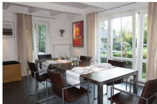
Der Tisch ist schon gedeckt ...