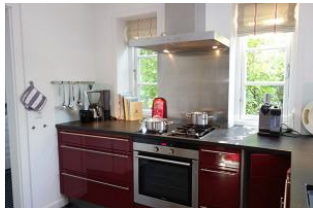
Die offene Küche mit Kochstelle E und Gas