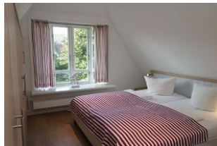
Das Elternschlafzimmer, Bettmaß 200x200cm Verdunkelungsmöglichkeit