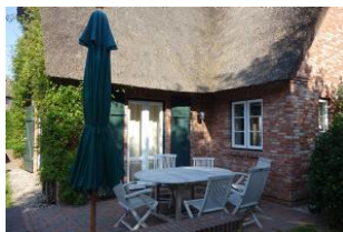
...und Terrasse 2