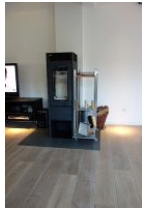
...ein gemütlicher Abend am Ofen ???