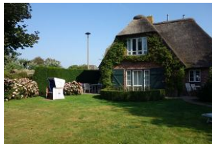
...großer Garten mit Strandkorb