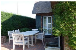
Bei bestem Wetter, Terrasse 1