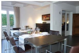
...nehmen Sie Platz!