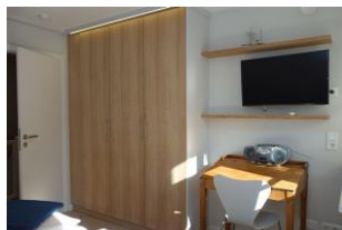
...auch hier ein TV Gerät