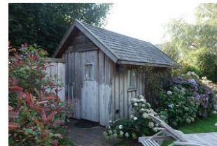
...das Saunahaus! (mit Extrakosten verbunden)