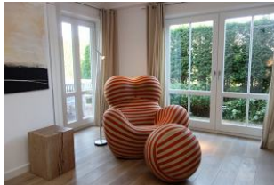
...mit einem spannenden Buch, doch Vorsicht, aus diesem Sessel mag man gar nicht mehr aufstehen...