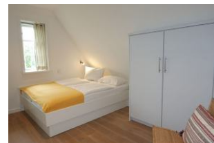
Das vierte Schlafzimmer mit Doppelbett 160x200cm (nicht im Bild: ein Schreibtisch)