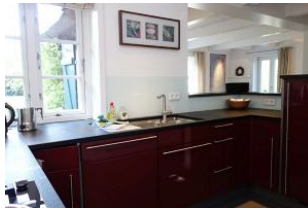
...Spüle, Kühlschrank + co