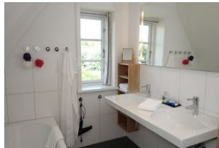
Das Bad im OG mit Doppelwaschtisch....