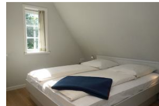
Das dritte Schlafzimmer mit Doppelbett, Bettmaß 180x200cm Verdunkelungsmöglichkeit