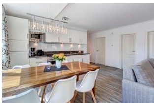
Küche und Essplatz