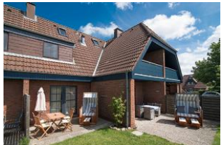
Kliffkoje No 1 und No 2 Terrassen

Gemütlich, hell, strandnah und modern. Ideal für 2-3 Erwachsene oder Familien mit 2 heranwachsenden Kindern ab 4 Jahren. Die Kliffkoje wurde komplett, inklusive neuer Küche und Badezimmer renoviert und mit Liebe neu eingerichtet. Durch die gute Aufteilung der Räume über zwei Etagen bietet dieses kleine Haus genug Platz, um sich wohl zu fühlen. Die zwei Schlafzimmer (mit einem Doppelbett 2 Einzelbetten; und davon ein Hochbett bis zu einer Körpergröße von max. 160 cm) liegen im OG. Das angrenzende Badezimmer mit WC und Duschkabine ist klein, aber fein. Im Erdgeschoss befindet sich ein kleiner Eingangsbereich, von dem aus Sie in das helle und schön eingerichtete Wohnzimmer mit Esstisch sowie integrierter, gut ausgestatteter Küche gelangen. Von der sich an das Wohnzimmer anschließenden Terrasse mit Gartenmöbeln haben Sie direkten Zugang zum Garten. Im hauseigenen Strandkorb genießen Sie auch bei einer steifen Brise die gute Nordseeluft. .