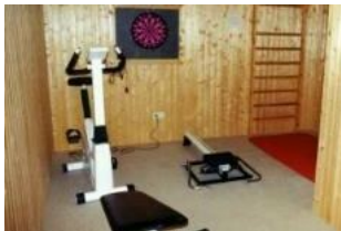
Der kleine Fitnessraum im Keller des Hauses.