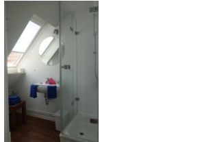
...und Handwaschbecken, nicht im Bild, die Toilette