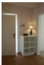
Der Eingangsbereich, Schuhschrank, Garderobe und mehr...

Frisch eingetroffen..... die neue Johanna 2, angelehnt an unser Haus Johanna für 8 Personen bietet die Ferienwohnung 4-5 Personen Platz. Mit viel Liebe zum Detail wurde die Whg. in 2017 renoviert und eingerichtet. Die Küche bietet den Mittelpunkt der Wohnung, aber auch das Wohnzimmer und das Elternschlafzimmer werden Sie gefangen nehmen. Ganz etwas Besonderes: die U 20 Zone, hier haben die jungen Gäste ihr Reich. Schlafzimmer, Spielzimmer (natürlich mit TV und DVD Player) sowie eigenem Duschbad..... wer kann dazu schon NEIN sagen ?????