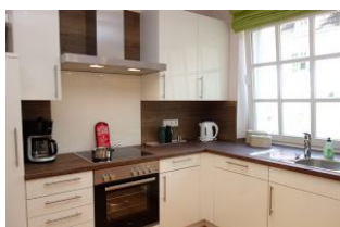
Die Küche im Einzelnen