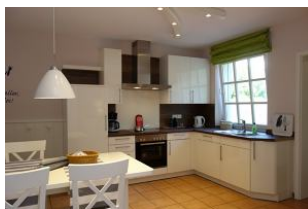
Herzlich Willkommen in der Wohnküche