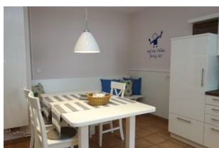
Der Essplatz ... Auf die Teller fertig los !