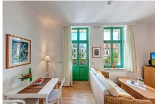
Küchenzeile und Eßplatz