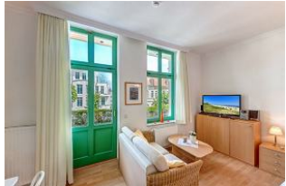
Kombinierter Wohn- / Schlafraum

STRANDNAH! Nur ca. 100 m zur Strandpromenade mit BALKON! Gemütliches 1-Zimmer-Apartment mit guter Ausstattung. Geräumiger Wohn-/Schlafraum mit Doppelbett und Sitz-/Sofaecke, Küchenzeile mit Essplatz, Duschbad, kleiner Vorflur, Balkon. Die Wohnung verfügt über einen Pkw-Stellplatz. Abstellraum für Fahrräder und ähnliches ist vorhanden. Eine Sauna in der "Villa Germania" kann kostenpflichtig genutzt werden. Vom Haus aus können Sie das Ortszentrum und die bekannte Ahlbecker Seebücke in ca. 3 bzw. 5 Minuten zu Fuß erreichen.