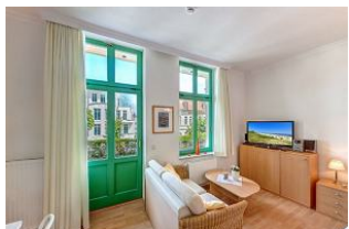
Kombinierter Wohn- / Schlafraum

STRANDNAH! Nur ca. 100 m zur Strandpromenade mit BALKON! Gemütliches 1-Zimmer-Apartment mit guter Ausstattung. Geräumiger Wohn-/Schlafraum mit Doppelbett und Sitz-/Sofaecke, Küchenzeile mit Essplatz, Duschbad, kleiner Vorflur, Balkon. Die Wohnung verfügt über einen Pkw-Stellplatz. Abstellraum für Fahrräder und ähnliches ist vorhanden. Eine Sauna in der "Villa Germania" kann kostenpflichtig genutzt werden. Vom Haus aus können Sie das Ortszentrum und die bekannte Ahlbecker Seebücke in ca. 3 bzw. 5 Minuten zu Fuß erreichen.