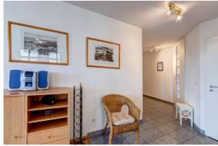
Blick in den Eingangsflur