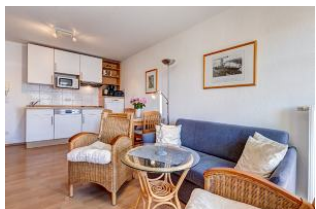
Wohnbereich, Essbereich, Küchenzeile