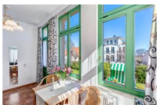
Essplatz mit Blick zur Terrasse mit Strandkorb

STRANDNAH! Nur ca. 100 m zur Strandpromenade mit TERRASSE, KLEINEM GARTEN und STRANDKORB! Gemütliches 2-Zimmer-Apartment mit freundlicher Ausstattung. Separates Schlafzimmer, Wohnzimmer mit Schlafcouch, Küchenzeile, Essplatz, geräumiges Duschbad, Terrasse mit Gartenmöbeln und STRANDKORB (Frühling bis Herbst) und kleinem Gartenstück, separater Eingang. Die Wohnung verfügt über einen Pkw-Stellplatz . Abstellraum für Fahrräder und ähnliches ist vorhanden. Eine Sauna in der "Villa Germania" kann kostenpflichtig genutzt werden. Vom Haus aus können Sie das Ortszentrum und die bekannte Ahlbecker Seebrücke in ca. 3 bzw. 5 Minuten zu Fuß erreichen.