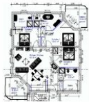
Wohnungsgrundriss (Möblierung exemplarisch)

STRANDNAH, GROSS, MODERN! Mit 2 BALKONEN (je ca. 11 qm), FAHRSTUHL, SAUNA und nur ca. 100 m zur STRANDPROMENADE! Großzügige elegante 4 - Zimmer - Wohnung mit sehr guter Ausstattung! 3 separate Schlafzimmer, 3 Bäder (2 davon ensuite), alle mit Fußbodenheizung. Die ensuite-Bäder verfügen über Wanne und Dusche bzw. Dusche. Das dritte Bad ist ein Saunabad mit Saunakabine und Schwalldusche. Der große Wohnbereich verfügt über eine vollausgestattete Küchenzeile, einen Eßbereich und einen Couchbereich mit KAMINOFEN. Die Balkone sind möbliert. Zur Wohnung gehört ein STRANDKORB AM STRAND. Die Wohnung verfügt über einen Pkw-Stellplatz in der teilüberdachten Tiefgarage. Fahrradabstellfläche ist vorhanden. Vom Haus aus können Sie das Ortszentrum und die bekannte Ahlbecker Seebücke in ca. 2 Minuten zu Fuß erreichen.