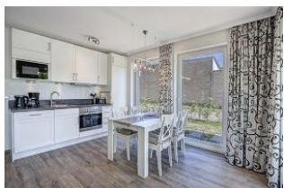
Essplatz und Küche