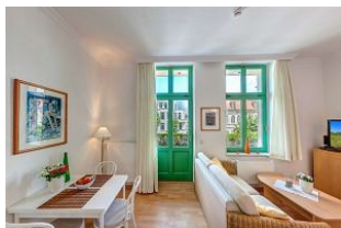
Küchenzeile und Eßplatz