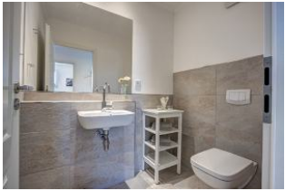
separates Gäste WC