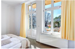
Schlafzimmer mit Blick zum Balkon