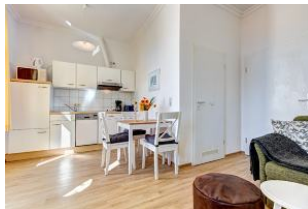
Wohnbereich mit Blick zu Küchenzeile und Essplatz