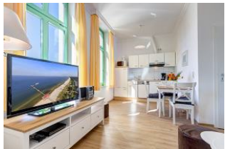
Wohnbereich mit Blick zu Küchenzeile und Essplatz