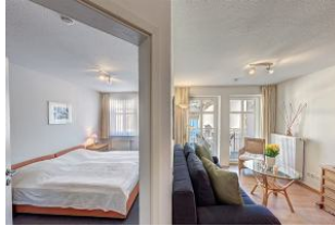
Tür zum Schlafzimmer