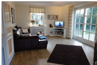
Das Wohnzimmer im nordischen Stil mit herrlich großer Sitzzecke.