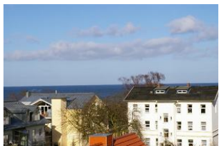
Seeblick Ostseewarte Nr. 17