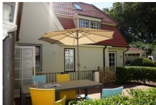
Die Terrasse mit großem Tisch und herrlich bequemen Sesseln.