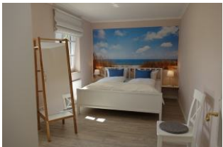
Das Elternschlafzimmer mit Nordseefeeing ....