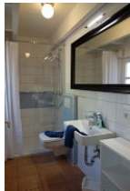
Das Duschbad im Erdgeschoß