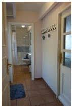
Der kleine Flur führt ins Bad. Rechts die Tür in die Garage, links die Tür auf die Terrasse