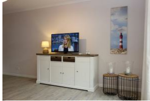
...TV Gerät und DVD Player ....