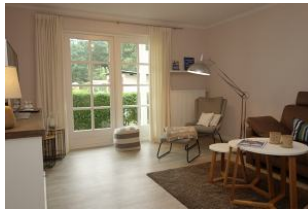
...hier noch einmal das Wohnzimmer..