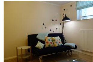
Das Spielzimmer mit Schlafcouch für Besuch...