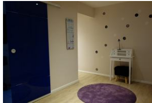
Hinter der Glastür verbirgt sich ....