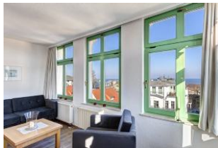
Wohnen / Seeblick aus der Veranda