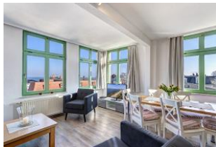
Wohnen / Essen