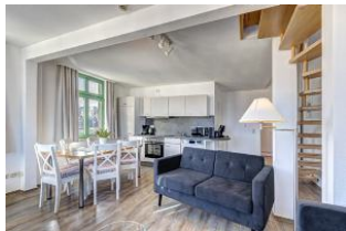
Wohnen / Essen / Küche