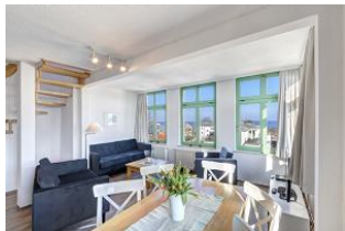
Wohnen / Essen / Aufgang

STRANDNAH mit SEEBLICK und BALKON! Nur ca. 100 m zur Strandpromenade! FAHRSTUHL im Haus. Schönes großes Maisonette-Apartment mit 4 Zimmern auf zwei Ebenen, gute Ausstattung. 3 Schlafzimmer, Wohnzimmer mit vollwertiger Küchenzeile und Essplatz, Duschbad (untere Ebene), Wannenbad (obere Ebene), zus. Gäste-WC, Eingangsflur, Balkon. Die Wohnung verfügt über einen Pkw-Stellplatz. Seeblick über die vorstehenden Häuser hinweg. Abstellraum für Fahrräder und ähnliches ist vorhanden. Vom Haus aus können Sie das Ortszentrum und die bekannte Ahlbecker Seebrücke in ca. 3 bzw. 5 Minuten zu Fuß erreichen.