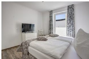
Schlafzimmer mit Flachbild TV