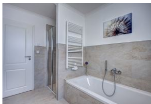
Bad mit Wanne und Dusche