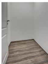
Abstellraum für Koffer, etc.