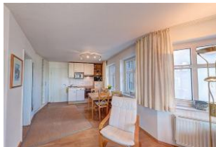
heller Wohnbereich mit Fernseher