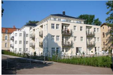
Hausansicht "Villa Aquamarina" von der Promenade