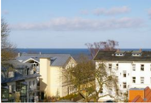
Seeblick vom Balkon