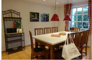
Herrlich - eine sep. Küche....