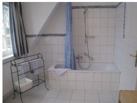
Badewanne, Duschkmöglichkeit vorhanden.