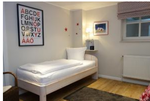
Ein Schlafzimmer mit 2 Einzelbetten, je 90x200cm