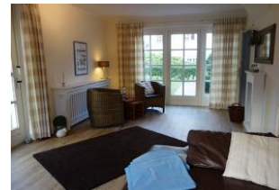
Eine kleine Sitzecke mit zwei Sesseln....