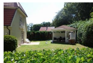
Der Pavillon und der Grill gehören zum Haus Johanna 1