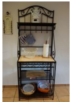
Modernes Sideboard ..