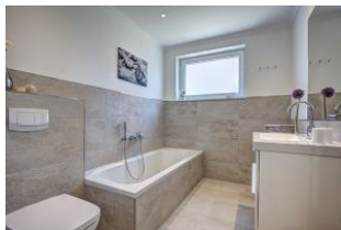
Bad mit Badewanne