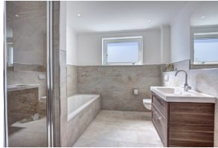
Bad mit Wanne und Dusche