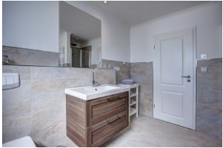
Bad mit Wanne und Dusche